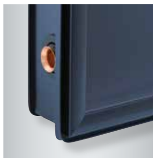
Vitosol 200-FM - Marco de aluminio de una pieza y junta continua de estanqueidad con el vidrio solar