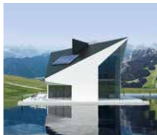
Modelo Vitosol 200-FM