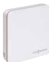
Termostato ViCare para mayor comodidad y eficiencia