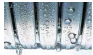
Intercambiador de calor Inox-Radial de acero inoxidable