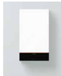
Vitodens 100-W (B1HF y B1KF)

La caldera mixta Vitodens 100-W incluye un intercambiador de placas para la producción de A.C.S.