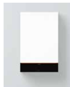
Vitodens 111-W (B1LF)