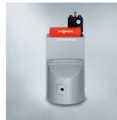
La caldera Vitorondens 200-T