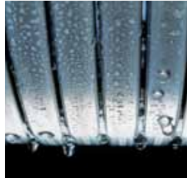
Intercambiador de calor Inox Radial duradero y eficiente

10 años de garantía para intercambiadores Inox-Radial de calderas a gasóleo Vitorondens