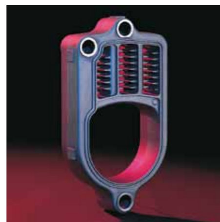
La superficie de transmisión Eutectoplex garantiza una larga vida útil y una elevada seguridad de funcionamiento

La centralita de regulación Vitotronic 200, con indicaciones claras y gráficos, permite al usuario un manejo dirigido por menú sencillo, autoexplicativo. Con el equipo Vitotronic pueden regularse cómodamente instalaciones de calefacción con un circuito de calefacción no mezclado y hasta dos circuitos mezclados.