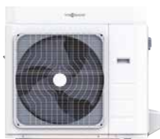
Vitocal 100-A entre 10 y 12 kW