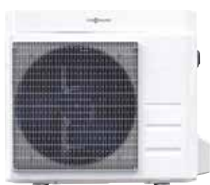
Vitocal 100-A entre 6 y 8 kW

Amplio rango de potencias disponible tanto en frío como en calor