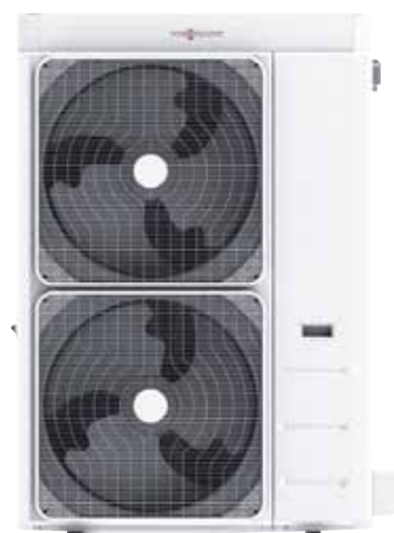
Vitocal 100-A entre 14 y 18 kW