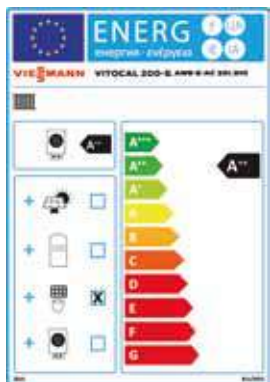
Clasificación energética A++