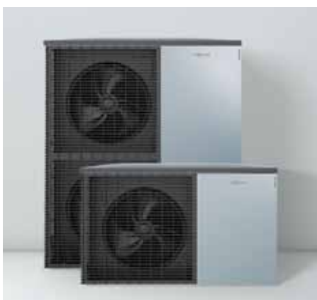
Nuevas unidades exteriores con diseño Viessmann – Made in Germany