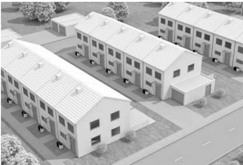
Funcionamiento especialmente silencioso, ideal para su uso en urbanizaciones de casas adosadas.

Los componentes esenciales contribuyen a incrementar eficiencia. Entre ellos están el compresor scroll con regulación de la velocidad, un intercambiador de calor de placas asimétrico y el nuevo intercambiador de calor de aire exterior.