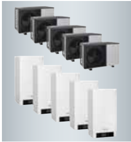
Secuencia inteligente de hasta 5 bombas de calor