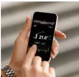
Control a distancia de un sistema de calefacción-refrigeración con regulación Vitotronic mediante conexión móvil a Internet.