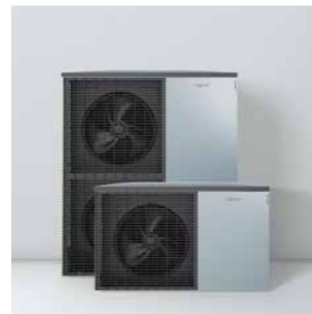
Unidades exteriores con diseño Viessmann Made in Germany

La combinación de módulos fotovoltaicos con las bombas de calor permite la producción de calefacción y agua caliente sanitaria a partir de energías 100% renovables.