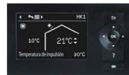
Pantalla de la regulación de la bomba de calor Vitotronic 200