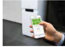
Control a distancia mediante conexión móvil a Internet