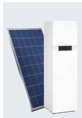
Pack Fotovoltaico y bomba de calor

5 años de garantía Opción de ampliación de la garantía del compresor