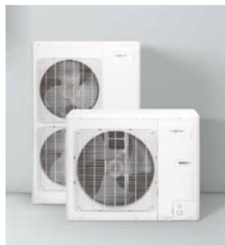
Unidades exteriores Vitocal 100-S

Con la interfaz de Internet Vitoconnect (opcional), las bombas de calor de aire-agua Vitocal 100-S/111-S pueden conectarse a internet. A través de la aplicación gratuita ViCare, es posible gestionar remotamente desde un smartphone muchas funciones como p.ej. la regulación de la temperatura ambiente, horario, A.C.S., etc.