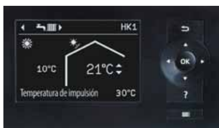
Regulación de la bomba de calor Vitotronic 200