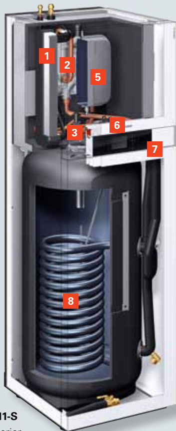
Vitocal 111-S unidad interior