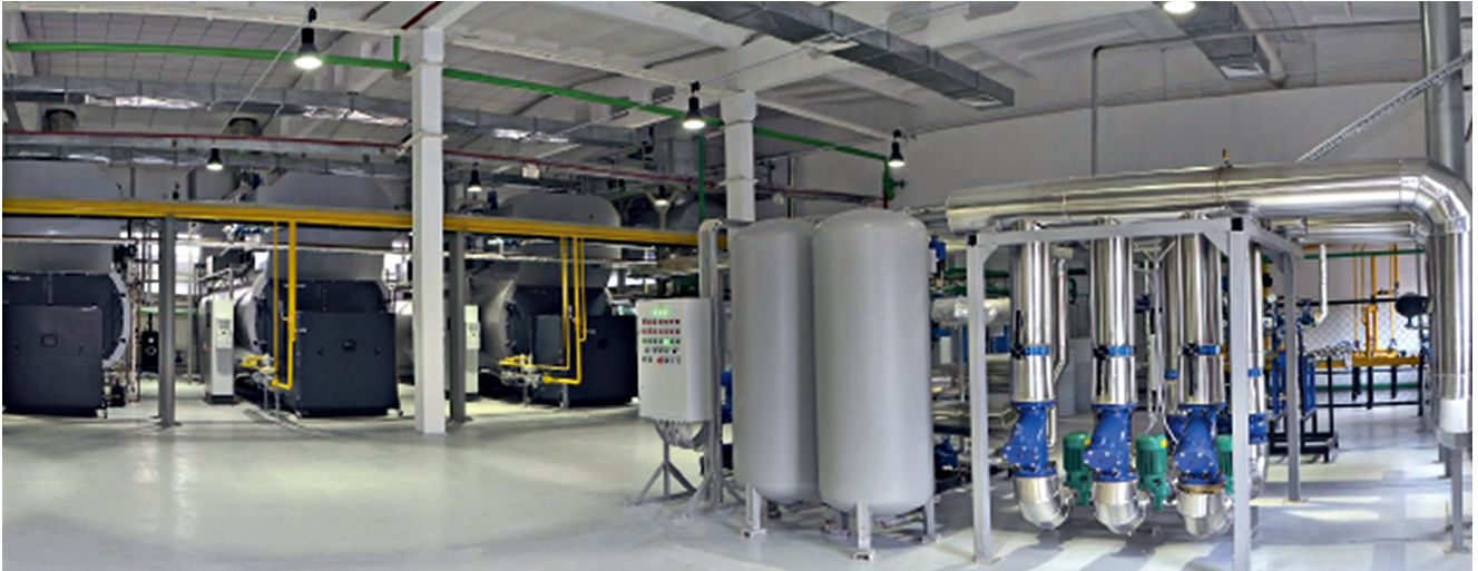
Central de energía con calderas Vitomax. Ya pueden operar al 100 % con hidrógeno.

En combinación con otras opciones de almacenamiento y producción «verdes», la proporción de combustibles fósiles se reemplaza de forma gradual. Este proceso, conocido como «Power-to-heat» o «Power-to-steam», cobra cada vez más importancia como acumulador de energía híbrido en la revolución energética y contribuye enormemente al cambio climático.